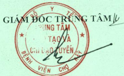
PGS.TS TRẦN MINH TRƯỜNG